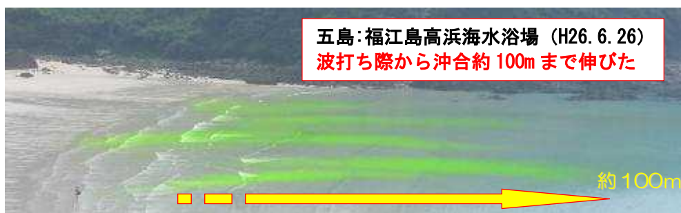
五島：福江島高浜海水浴場（H26. 6. 26） 波打ち際から沖合約 100m まで伸びた